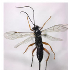
Рис. 4 Pimpla rufipies (Miller, 1759) – новый выявленный вид паразитоида Cydalima perspectalis